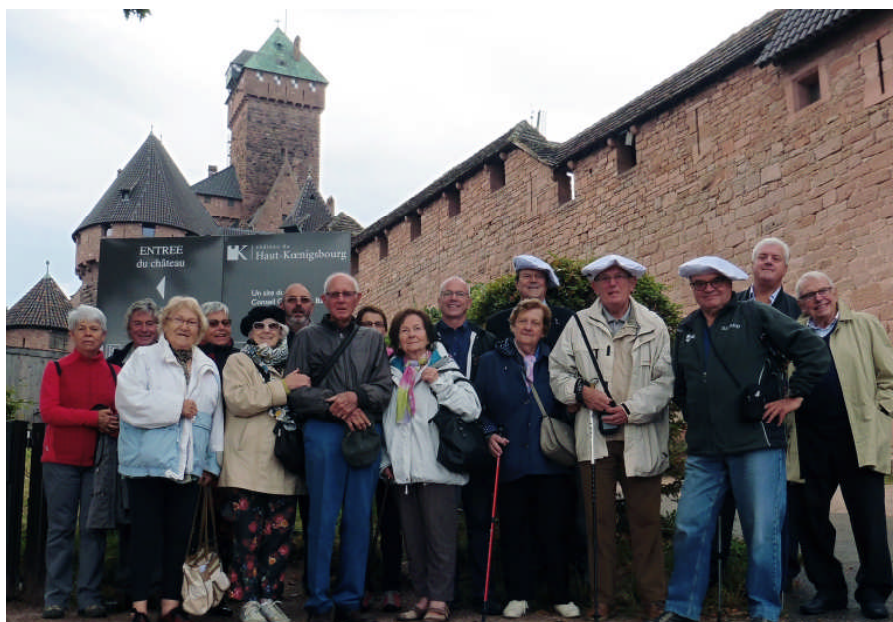
Château Haut Koenigsbourg