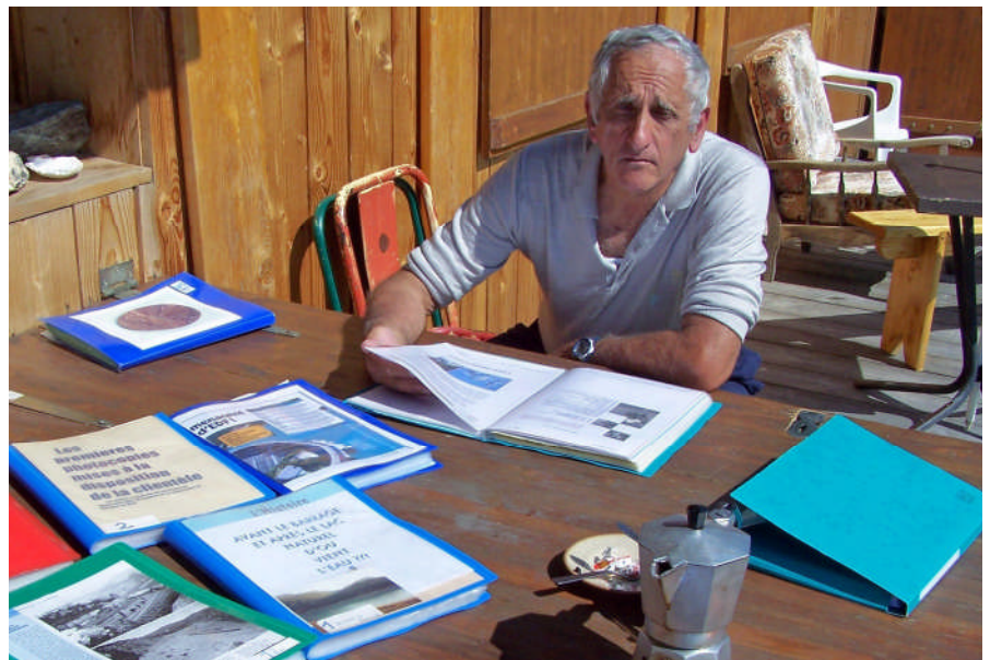
Barrage de la Girotte 13 sept 2007