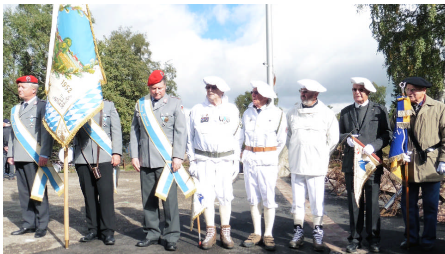
Cérémonie au Mémorial du Lingé