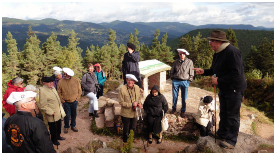
Visite du Mémorial du Lingé

Des membres ont participé à des cérémonies avec la 27 e BIM, l'EMHM et certaines unités, notamment avec le 7 e BCA.