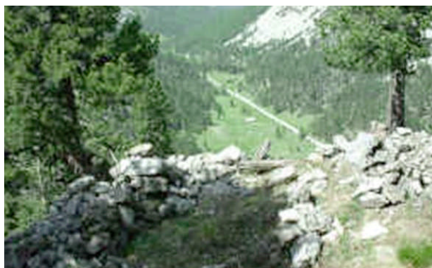
Vue sur le col de l'Échelle depuis le PA du Lieutenant Bues.