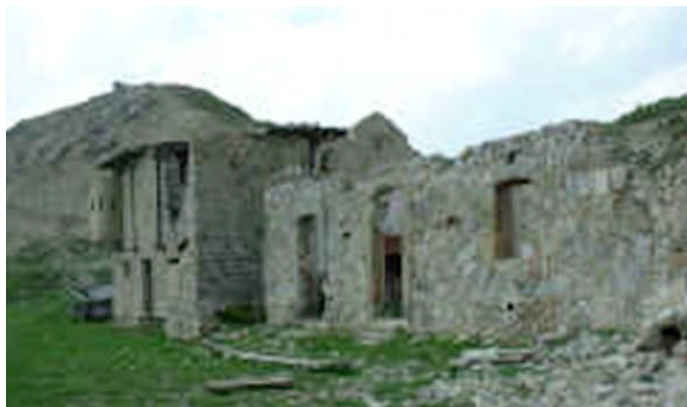
Vue d'un des baraquements des Acles avec en arrière-plan le Piton Jaune