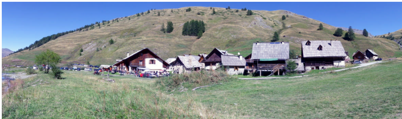
Les Fonts de Cervières

.../...Suite de l'article «Rassemblement national»