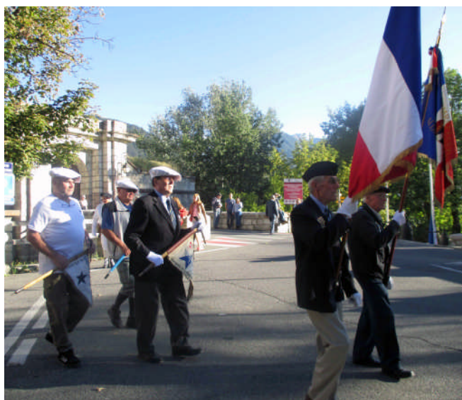
Commémoration de la libération de Briançon le 6 septembre 1944