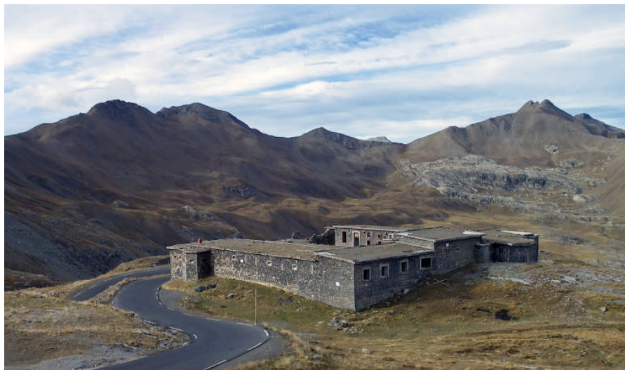
Ouvrage de Restefond

La route de Nice ayant été coupée par les militaires en amont de St Sauveur sur Tinée, c'est à pied, de nuit, par les cols de la montagne, situés à plus de 2200 m d'altitude, que les habitants durent évacuer leurs villages. Ils gagnèrent ainsi la vallée du Var où des véhicules les attendaient pour les transporter dans la vallée du Verdon, à St André les Alpes. Ils y séjournèrent un mois environ.