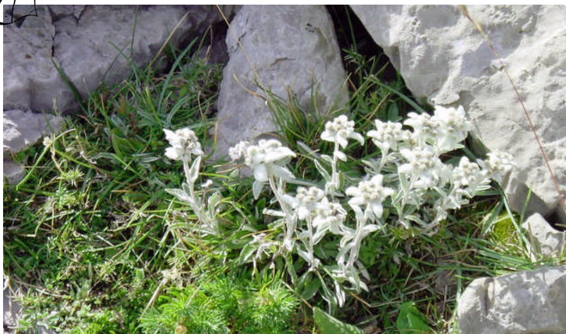
Edelweiss photographiées vers Saint Auban par Jean-Émile David.