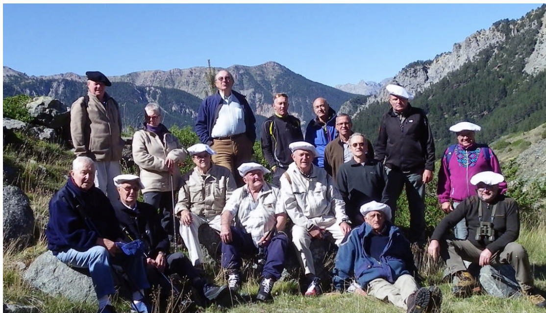
Visite de l'ouvrage des Aites

terrain des Aites situé dans la vallée de la Cerveyrette. Cet élément défensif de la partie alpine de la ligne Maginot souvent méconnu, construit de 1932 et 1938 et nous sommes impressionnés par le travail fourni par la main d'œuvre militaire. Cet ouvrage comprend 4 blocs de tirs décalés en altitude et des galeries de plusieurs centaines de mètres, le tout entretenu grâce à l'action de passionnés du pays.