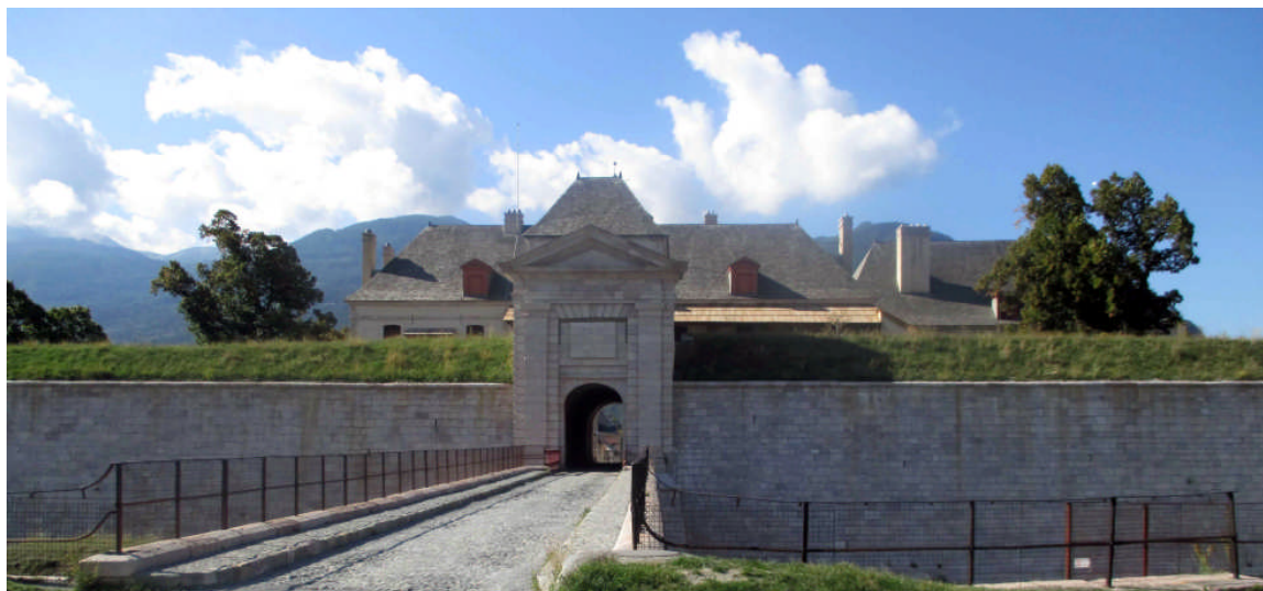
Visite du Fort de Mont Dauphin