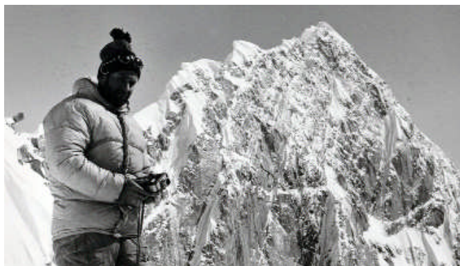
Mont Huntington 1964 de JL Bernezat