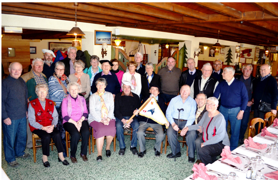
Les participants à l'AG de la section Alsace-Vosges