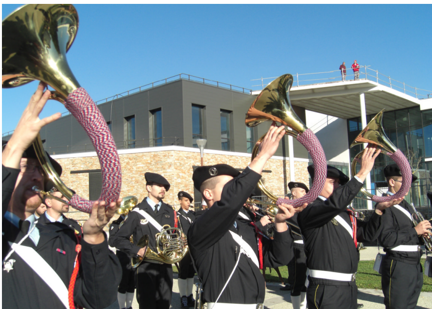
La fanfare du 27 e BCA