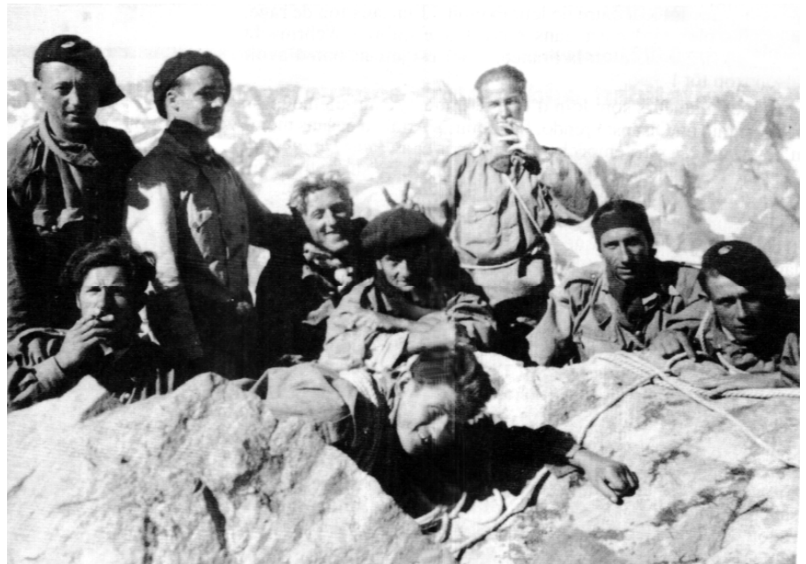
Trois des neufs cordées au sommet du Grand-Pic de la Meije, le 22 juin 1938

accrochés à l'altitude moyenne de 1900 mètres. Vers l'est, la frontière (la « crête aux eaux pendantes » comme on disait joliment autrefois pour désigner la ligne de partage des eaux) ne s'abaisse jamais en dessous de 2 300 mètres et dépasse souvent les 3000 mètres ; elle forme saillant en territoire italien, ce qui allonge son tracé : j'ai ainsi avec mes quarante éclaireurs, rien moins que quatre-vingts kilomètres de frontière à surveiller.