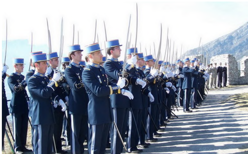
L'après-midi au mémorial du Mont Jalla