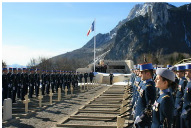
Le matin au mémorial de St Nizier