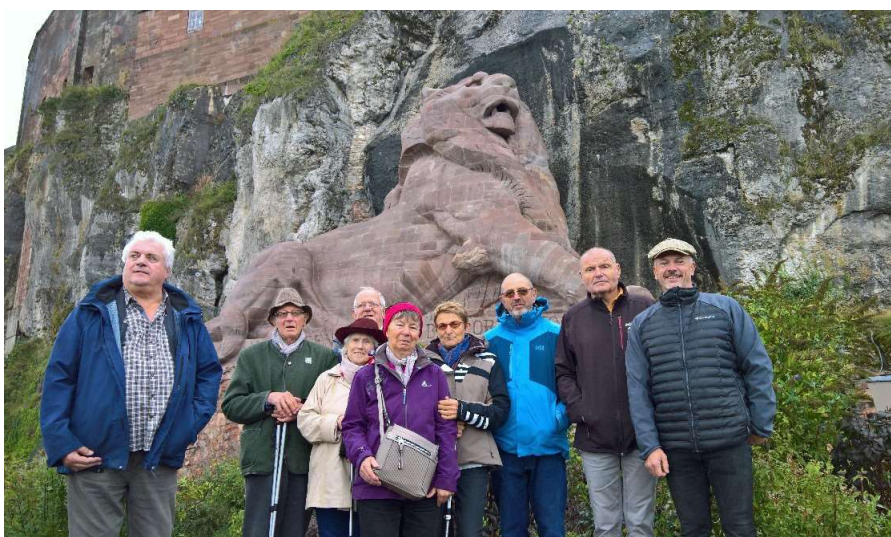
La citadelle de Belfort