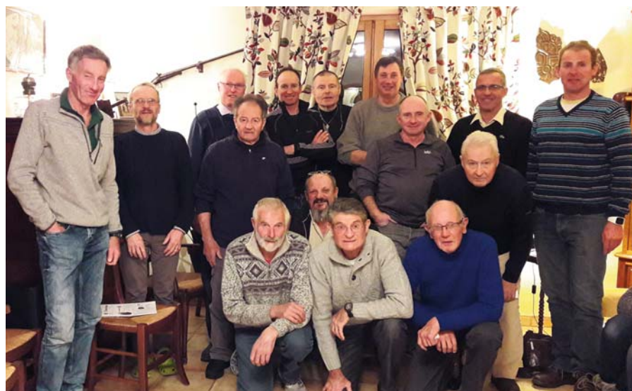
Alpes, galette des rois du 13 janvier 2018

Deux séances de tir, soit à la carabine à plombs et ou à balles et au pistolet, ont pu se dérouler grâce à des amicalistes appartenant au club de tir de Briançon. Elles furent suivies d'un moment convivial autour d'un barbecue et des enfants d'un adhérent se sont joints à nous.