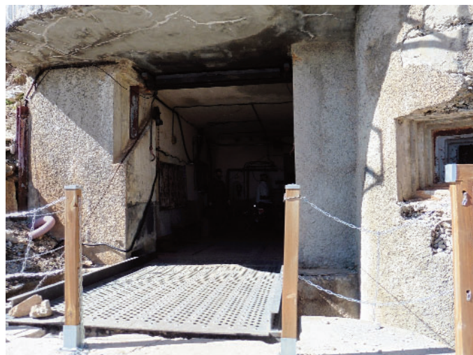
Entrée du Janus