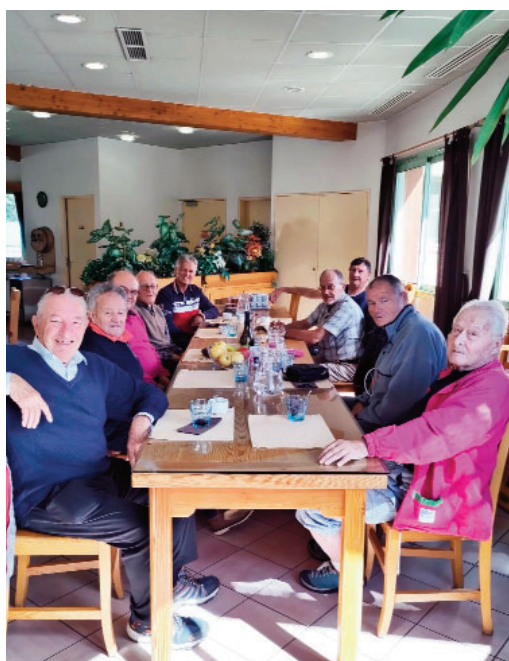
CIPPA du 24 septembre 2023