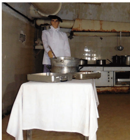
Cuisine du Janus

Le soir après le repas, nous allons à la salle de réunion pour l'assemblée générale annuelle (compte-rendu ci-après).