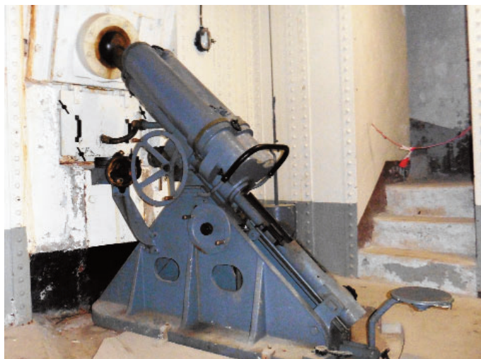
Mortier de 75