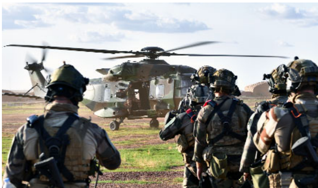
Le GCM en entraînement aérocordage

Unité de circonstance interarmes, forte de 220 soldats provenant des différentes unités de la brigade, le groupement commando montagne ou GCM est le «Fer de lance» de la 27e BIM. Créé en 2004, il a su prouver sa redoutable efficacité en Afghanistan et dans la Bande Sahélo-Saharienne. Héritier d'unités aux noms divers, il inscrit son action dans une longue tradition de capacité commando dédiée à l'engagement en montagne. Nous fêtons ses 90 bougies.