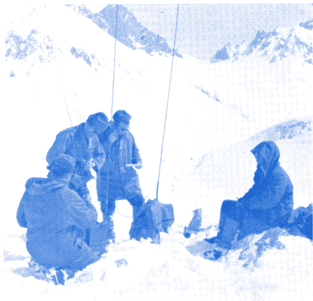
Transmettre les coordonnées sans se tromper !

Les meilleurs skieurs et tireurs du Régiment, sous-officiers et hommes de rang, sont sélectionnés en fonction de leur technique, de leur endurance et de leur volonté.