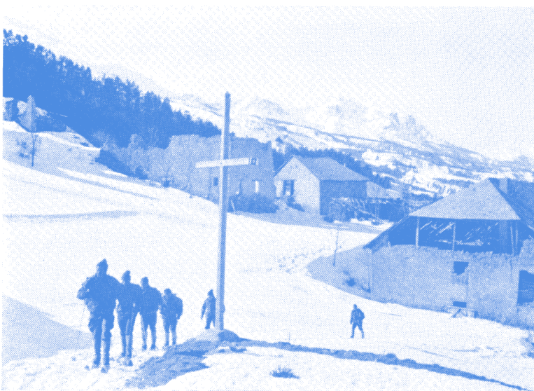
Hier : ici en patrouille, le B.S.M. au 11 e B.C.A.

d'Eclaireur. Ces souvenirs que tu vas garder ne sont pas ceux d'une cour de caserne, mais ceux qui se sont déroulés dans le cadre magnifique de nos montagnes. Même si ces souvenirs sont actuellement un peu masqués par la joie de la liberté retrouvée, ils t'ont marqué et crois-moi ils te seront encore de plus en plus précieux à mesure que tu avanceras dans la vie.