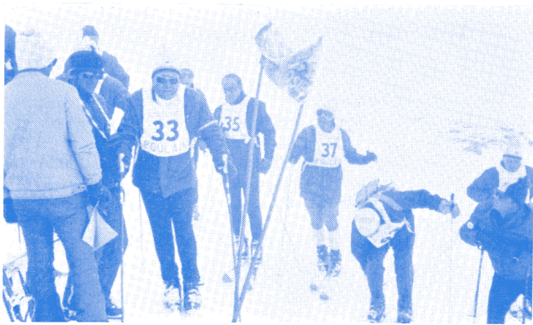
DEMAIN : Départ d'un GÉANT avec les AES

amis, des frères, heureux de se retrouver sur un plan d'égalité totale en montagne.