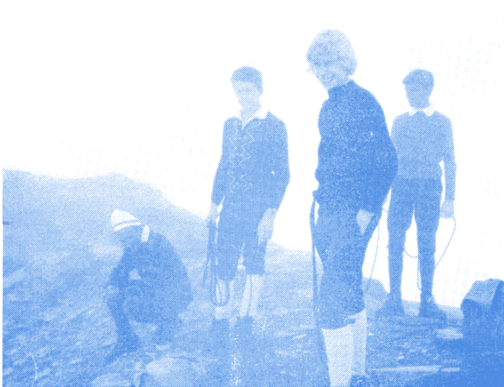
Ils sont plein de "MORDANT"