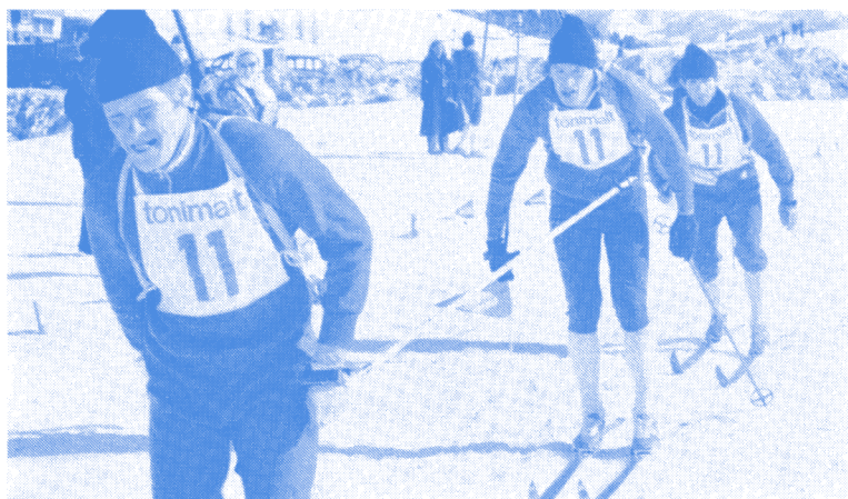
Hier : Compétition Militaire