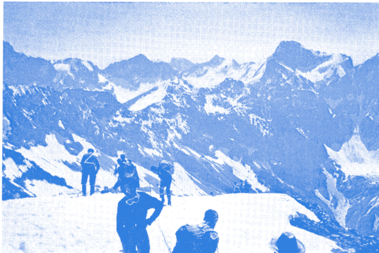
Demain : Avec les AES aux ROUIES

L'amour de la montagne, la camaraderie, la simplicité sont les autres atouts majeurs de nos rassemblements.