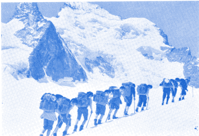
En marche d'approche, chargés comme des mulets !

LA SECTION "OBSERVATION HAUTE MONTAGNE" du 93 e R.A.