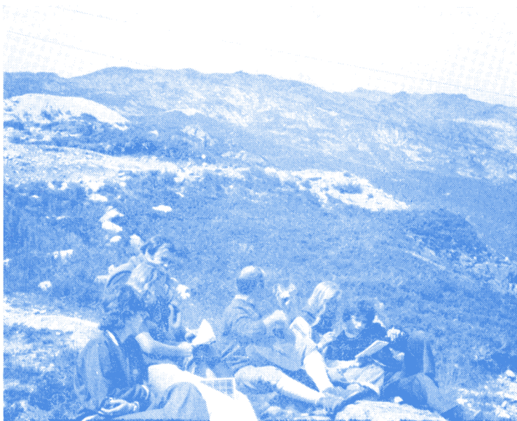
Les Jeunes chantent à la Flégère