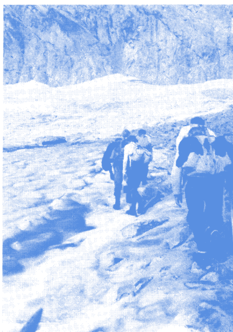
A la Flégère : le premier névé sous le Col du DARD