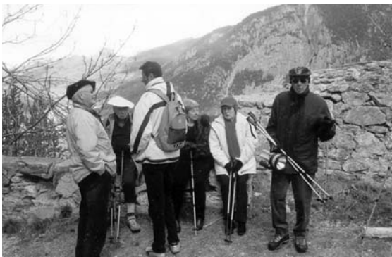
Au fort du Randouillet