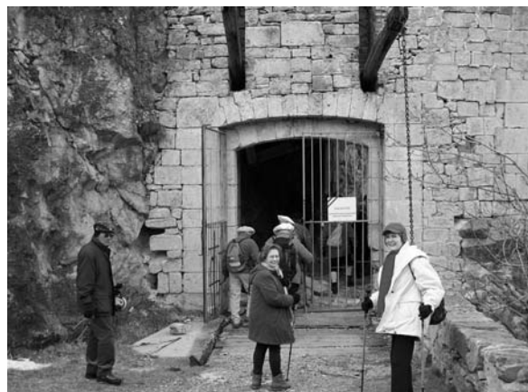
Au fort du Randouillet