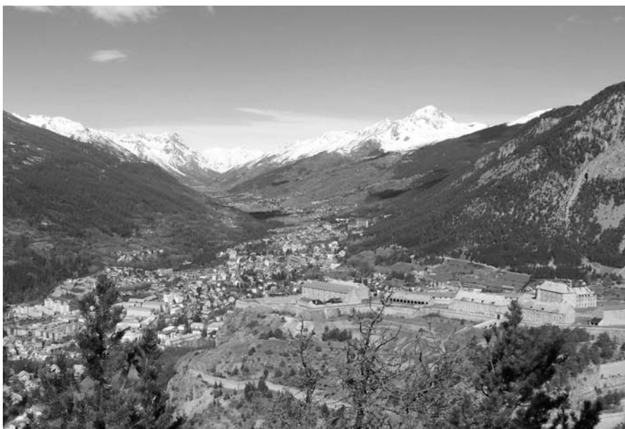
Briançon vue du Fort du Randouillet