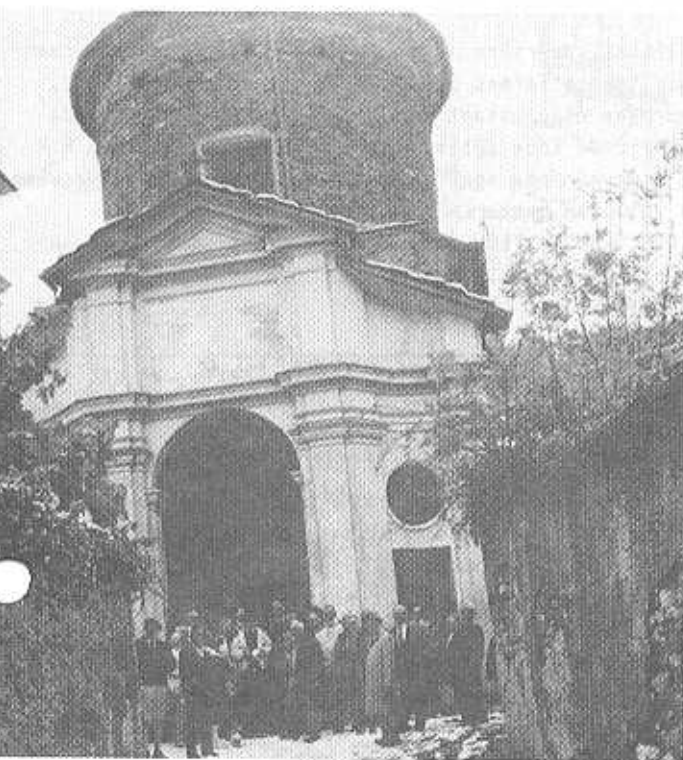
Chapelle du Souvenir avant les arènes en Italie.

du 11 e BCA et le Lt-colonel Sarailh du Centre d'Instruction et d'entraînement au Combat en Montagne) signifiait d'abord le départ définitif du 11 e BCA. Un départ digne et discret bien dans la tradition des chasseurs