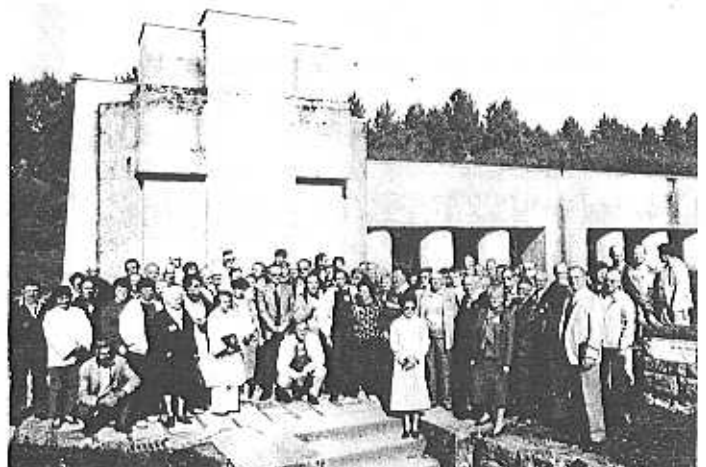
La Tranchée des Baionnettes.

Dans la soirée, après nous être regroupés au bas du cimetière de Douaumont, nous gravâmes dans le plus profond silence la pente gazonnée qui au milieu des 15 000 tombes mènent à l'ossuaire. La cloche sonnait le glas. Précédés de nos fanions nous marquâmes un temps d'arrêt au pied du mâit ou flotte en permanence les couleurs de la France. Chacun en soi-même pouvait se remémorer la génération de nos Pères qui avait offert sur cette terre de Verdun ses souffrances et beaucoup d'entre eux leurs vies, pour que nous, leurs Fils puissions vivre libres.