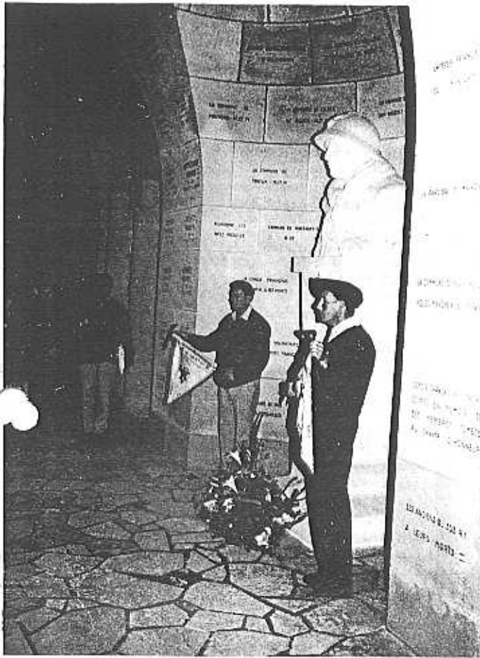
Le dépôt de gerbe au Poilu de Verdun