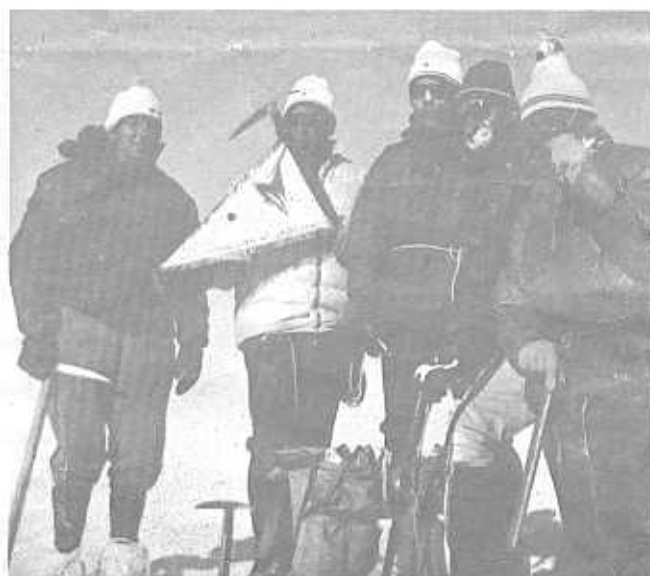
Le Président national et quelques A. E. S. au sommet du Mont-Blanc

le fanion des anciens éclaireurs - skieurs a flotté sur le mont-blanc le 19 juillet 1970