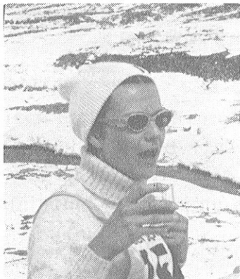
Le Coup de Beaujolais de notre concurrente.