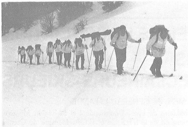
En HIVER, dans les massifs de la Chartreuse, du Verscors, du Thabor et du dôme de la Lauze