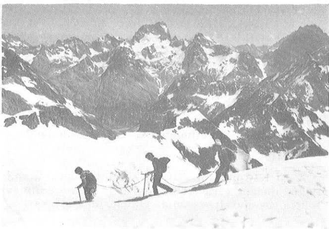
Une cordée à la descente

Le soleil heureusement était de la partie et rapidement apparaissaient les torses nus, les gourdes se vidaient elles aussi ! !.