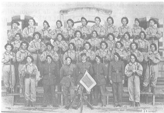
Une S.E.S. en 1930 à Mont-Louis

Espérons que nous verrons ces garçons dans nos rangs lors des prochains rassemblements !