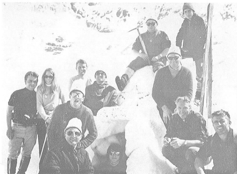
Igloo des A.E.S.

objectifs futurs, le G o Le Ray dit tout son plaisir d'être présent à cette assemblée et c'est à la santé des participants et des absents que l'on bu un petit beaujolais, en intermède avec le passage des films sur le baptême du fanion au Mont Blanc et la sortie de Villard-de-Lans.