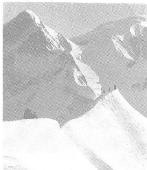
En ETE dans les massifs Trelatête l'Oisans

A plusieurs reprises des Cadres et Eclaireurs du 6 e B.C.A. ont participé aux Rassemblements de l'A.N.A.E.S.