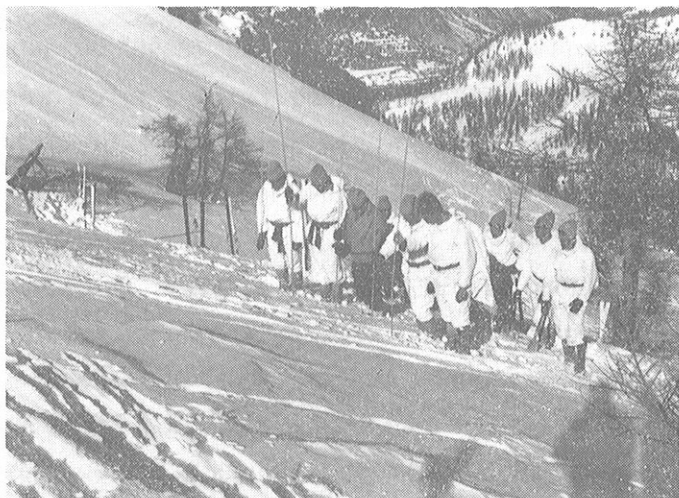
Recherche d'un corps dans une avalanche

Après les Championnats les 3 équipes sont regroupées pour former la S.E.M. à qui est confié des Missions de Reconnaissances à l'Echelon Régiment, des Missions Particulières : Equipement de passage difficiles pour le Bataillon ou le Régiment.