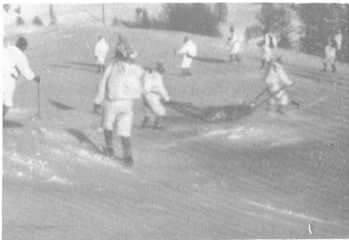
Évacuation du blessé en barquette par la S.E.M.

Naturellement à ce que l'on voit le travail ne manque pas à la S.E.M..