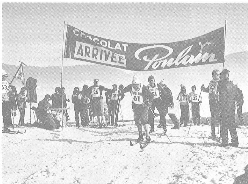
Passage d'un RELAIS sous l'œil attentif des autres concurrents et du chronométrateur officiel.