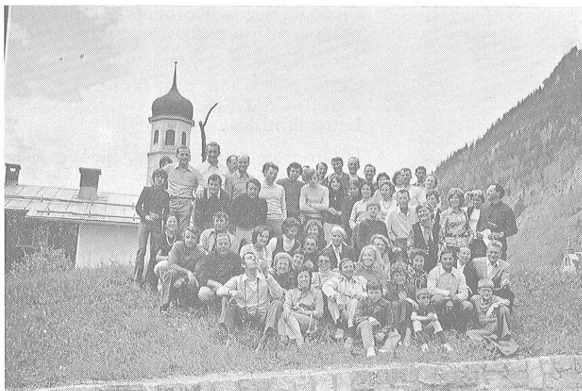
Le groupe des A.E.S. à WALD

Réunis à KLOSTERLE, à l'hôtel KRONE, les A.E.S. et leurs épouses ont retrouvé l'ambiance de leur vingt ans.