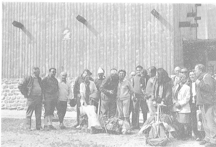
Tout a une fin. Un premier groupe au retour va se quitter. Mais "ce n'est qu'un AU REVOIR".

N'ai-je pas entendu dire que certains dirigeaient dès maintenant leur regard vers... la Vallée Blanche pour 1974. Pourquoi pas ?